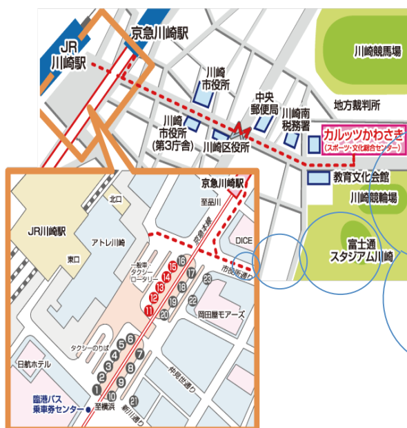
川崎駅東口拡大図